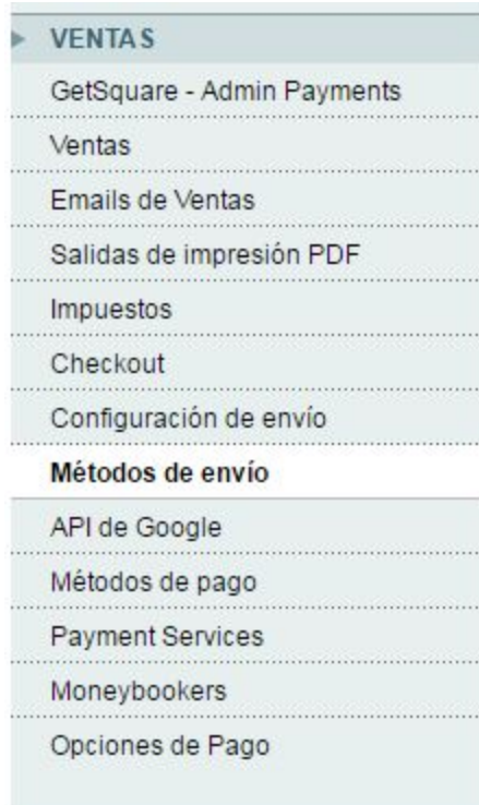
Imagen 1 - Acceso a métodos de envío de Magento

El método de envío Pickit, aparece bajo el nombre "Pickit - Configuración Global". Tiene dos secciones de configuración: Configuración Global ( Imagen 2 ) y Configuración de Envío Pickit ( Imagen 3 )