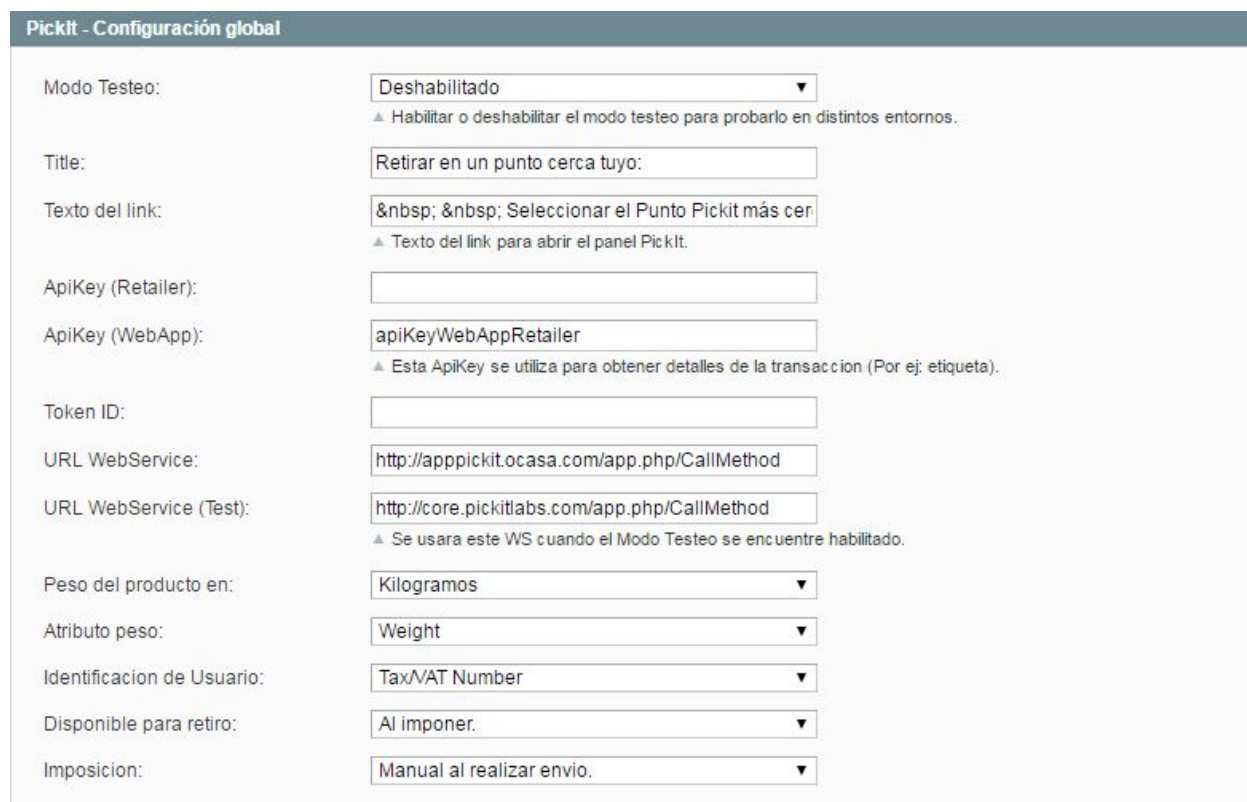
Imagen 2 - Configuración Global del Módulo Pickit

Configurando el campo Imposición como “Manual al Realizar Envío” y el campo Disponible para Retiro como “Al Imponer”, cuando una orden sea enviada en magento (Acción de envío estándar de Magento), quedará automáticamente en estado Disponible para retiro (el correo estará notificado de que la tiene que pasar a buscar) y se generará la correspondiente etiqueta (Ver sección 5).