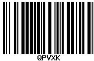
Imagen 5 - Ejemplo de Etiqueta Pickit